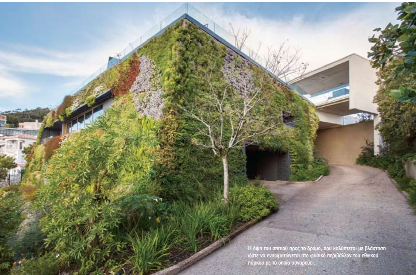
Η όψη του σπιτιού προς το δρόμο, που καλύπτεται με βλάστηση ώστε να ενσωματώνεται στο φυσικό περιβάλλον του εθνικού πάρκου με το οποίο συνορεύει.

ράντα, την πισίνα και τον κήπο. Στο πιο ψηλό επίπεδο βρίσκονται τα υπνοδωμάτια, στρατηγικά τοποθετημένα για προστασία της ιδιωτικής ζωής. Μια κομψή σκάλα στην καρδιά του σπιτιού, επενδυμένη με χαλκό, οδηγεί από την κουζίνα στο χειμερινό σαλόνι με το τζάκι, ή στο καλοκαιρινό, που ενώνεται με τη βεράντα. Η διαστρωμάτωση αυτή επιτρέπει διαφορετικές εμπειρίες ανάλογα με το πού βρίσκεται κάποιος, ενώ το μέγεθος και η ανοικτόσύνη των χώρων τονίζουν τη μαγεία του τοπίου, με τη θάλασσα και το βουνό να είναι πανταχού παρόντα. Αυτό επιτυγχάνεται και με τον τρόπο που διαμορφώθηκε η αυλή, με ένα κτιστό κίосκo να τη διακόπτει και ταυτόχρονα να την ενσωματώνει. Τα δάπεδα δε, από γυαλισμένο σκυρόδεμα, τόσο στο εσωτερικό όσο και στο εξωτερικό, εξασφαλίζουν την απρόσκοπτη συνέχεια των χώρων. «Είναι ένα σπίτι για όλες τις εποχές και παίζει με τις διαθέσεις του κλίματος και του γύρω τοπίου», εξηγεί ο επιβλέπων αρχιτέκτονας Tamaryn Fourie. Με περιορισμένους τοίχους και κολόνες, ακόμα και χωρίς υαλοπίνακες, όπου είναι δυνατόν, μοιάζει με υπόστεγο με μια πολύ κομψή στέγη που δίνει την εντύπωση πως αιωρείται πάνω από τους όγκους, ενώ από άλλη οπτική γωνία μοιάζει μονολιθικό. Τα υλικά που έχουν χρησιμοποιηθεί, όπως φυσικό ξύλο βαλανιδιάς, χαλκός, γρανίτης, έρχονται σε αντίθεση με το μπετόν και τονίζουν τις λιτές γραμμές της αρχιτεκτονικής προσθέτοντας παράλληλα ζεστασιά σε ένα σπίτι χιλίων σχεδόν τετραγωνικών, του οποίου οι ιδιοκτήτες είναι εμφανές πως δεν είχαν περιορισμό στον προϋπολογισμό.●