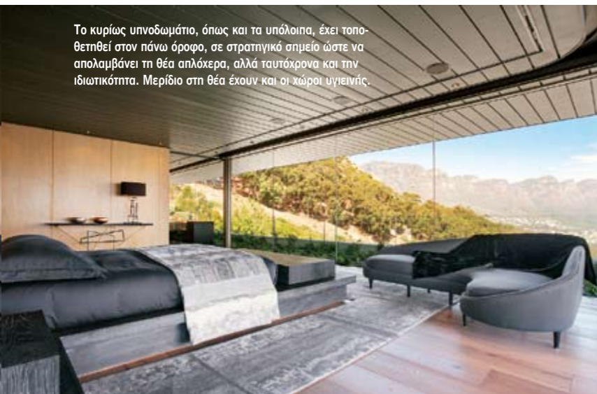
Το κυρίως υπνοδωμάτιο, όπως και τα υπόλοιπα, έχει τοποθετηθεί στον πάνω όροφο, σε στρατηγικό σημείο ώστε να απολαμβάνει τη θέα απλόχερα, αλλά ταυτόχρονα και την ιδιωτικότητα. Μερίδιο στη θέα έχουν και οι χώροι υγιεινής.